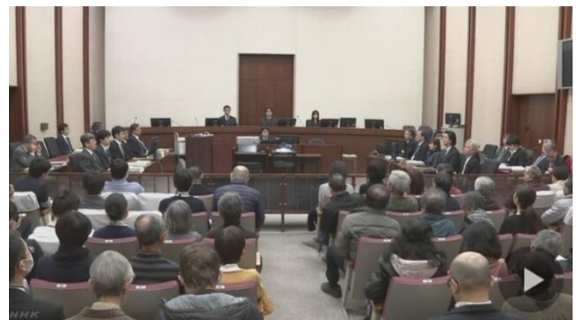
「津波想定小さくできないかと東電が依頼」 グループ会社社員