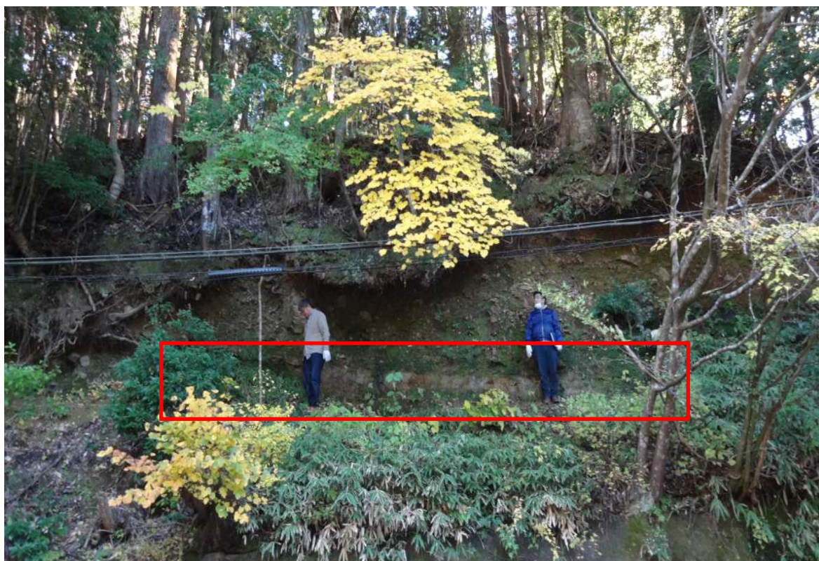
図表5 越畑地点におけるDNPとその上の堆積層の状況（甲 D218）

の上には数mの堆積物が存在することが分かる（写真に写っている原告ら代理人の身長は概ね1 m 7 0 cm程度）。これだけの堆積層が載っている以上、圧密によって、降灰当時と比較して、相当程度層厚（体積）が減少していることは経験則に照らして疑いがない。